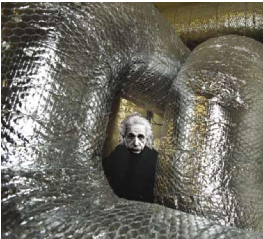
(The picture is a montage)

"Everything should be made as simple as possible, but not simpler" Albert Einstein